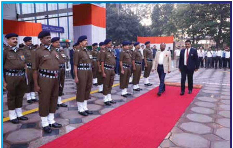
स्वतंत्रता दिवस के अवसर पर माननीय अध्यक्ष महोदय द्वारा सुरक्षा कर्मियों की समीक्षा

बाहरी प्रशिक्षण : वरिष्ठ पदधारियों को उच्च स्तर/विषय केंद्रित बाह्य प्रशिक्षण प्रदान किया गया। इस तरह का प्रशिक्षण इसलिए महत्वपूर्ण है क्योंकि उनके प्रबंधन दर्शन, दृष्टिकोण और प्रकृति का, बैंक में नीति निर्माण और कर्मचारियों की बड़ी संख्या पर महत्वपूर्ण प्रभाव पड़ता है।